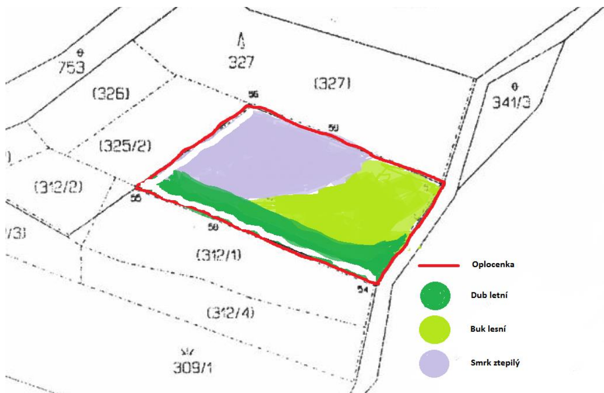
Příloha č. 3: Kopie katastrální mapy s návrhem rozložení dřevin po ploše včetně oplocení